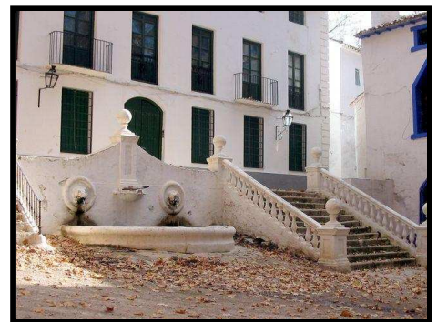
Mata Bejid

Desde aquí es fácil volver al punto de partida por la carretera, aunque es recomendable continuar por un carril que entre olivos va paralelo a esta un buen tramo.