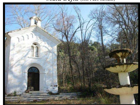
Ermita de Mata-Bejid