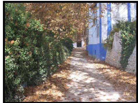
Mata Bejid

Tipo: Senderismo Trayecto: Circular Longitud: 10 Km. Dificultad: media Tiempo estimado: 4 horas