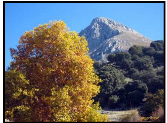
Vista de Peña de Jaén

Tipo: Senderismo Trayecto: Circular Longitud: 10 Km. (ida) Dificultad: Alta Tiempo estimado: 8 horas (ida y vuelta)