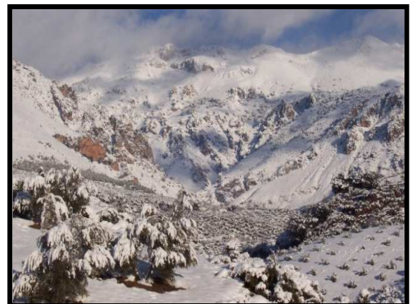
Vista de Mágina nevada, Pico Sierra Mágina

Desde esta cima necesitaremos poco más de media hora para llegar a la cima Mágina. El sendero continúa de dolina en dolina (utilizadas antiguamente para acumular la nieve y extraer el hielo en verano). El paisaje que se divisa es magnífico: llanuras matemáticamente cubiertas de olivares y, al sudeste, las altas cumbres de Sierra Nevada que, en invierno, destacan por encima del horizonte haciendo honor a su nombre.