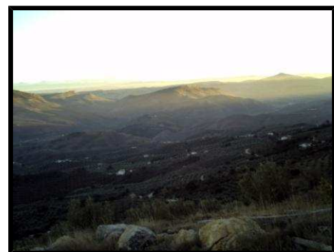
Vistas desde el mirador de la Majada del Sebo