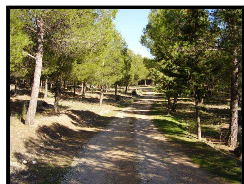
Sendero de Gualijar